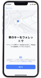
4. デジタルキー登録画面>続ける