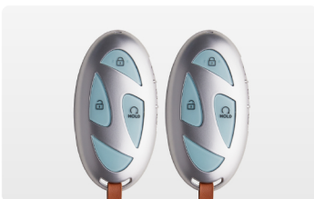
1. スマートキー2本を持って車に乗車