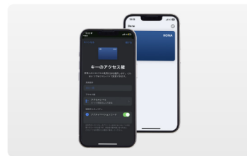
3. デジタルキーのシェア