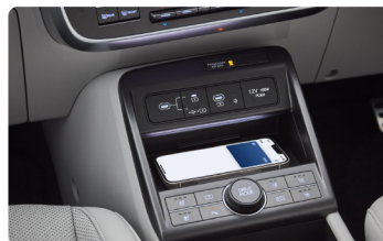
2. ワイヤレス充電パッドにスマートフォンを置く