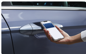
1. ドアのロック/アンロック