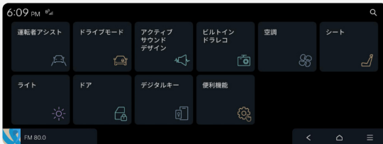
3. デジタルキーメニューボタンを選択