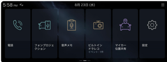
1. ホーム画面を右にスライド>設定メニューボタンを選択