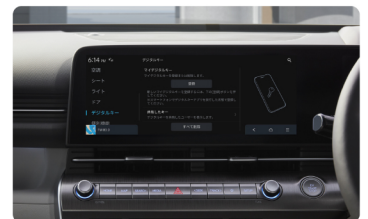
3. ナビゲーション画面でデジタルキーを発行